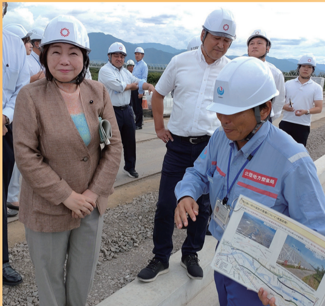
県土都市整備委員会委員長として、令和元年東日本台風で甚大な被害が発生した「信濃川水系緊急治水対策プロジェクト」による国・県・市が一体的に対策を実施している、国交省 千曲川河川事務所 治水対策箇所を視察しました。本県においても、流域治水に取り組んでいることから、今後の施策推進の参考といたします。

【所属委員会】 常任委員会…県土都市整備委員会(委員長) / 特別委員会…公社事業対策特別委員会