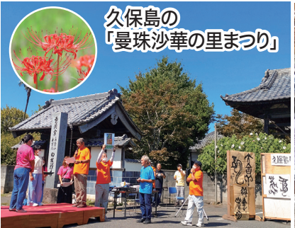
久保島の 「曼珠沙華の里まつり」