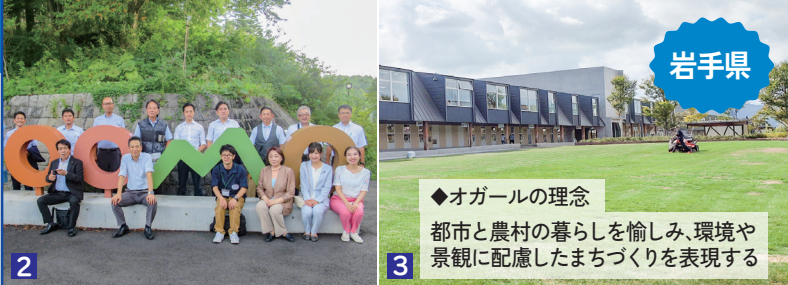
2 多くの来場者があるZOOMO 公民連携手法を活用しているオガール