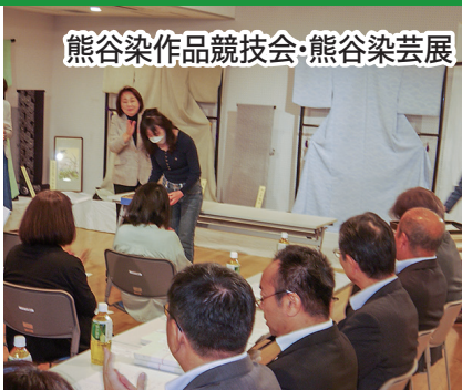
熊谷染作品競技会・熊谷染芸展