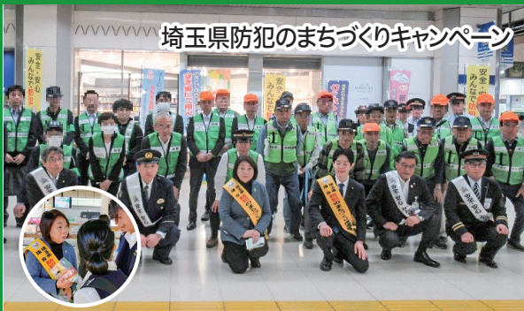
埼玉県防犯のまちづくりキャンペーン