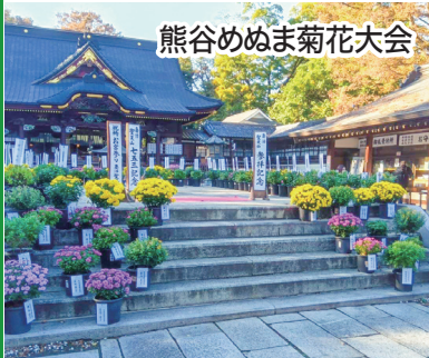
熊谷めめ菊花大会