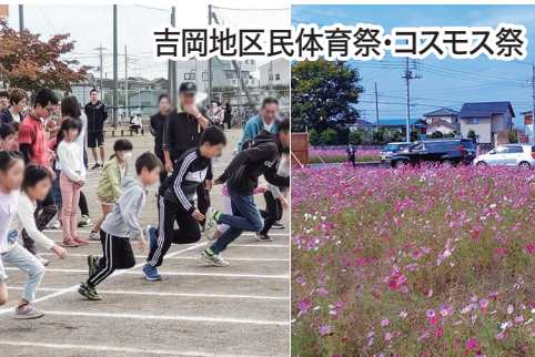
吉岡地区民体育祭・コスモス祭