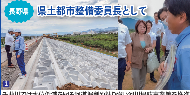
1 千曲川では水位低減を図る河道掘削や粘り強い河川堤防事業等を推進

小諸市 飯綱山公園「スタラス小諸」 公共事業における Park-PFI等の民間活用