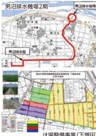
ほ場整備事業(下増田)

6月定例会では県土都市整備委員長として、本会議において委員長報告を行いました(7月7日)。